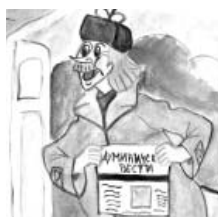
Подписка на «ДВ» - на почте и у почтальонов.

Присоединяйтесь! И всё интересное не пройдет мимо, а все полезные новости придут вовремя. Прямо в ваш почтовый ящик.