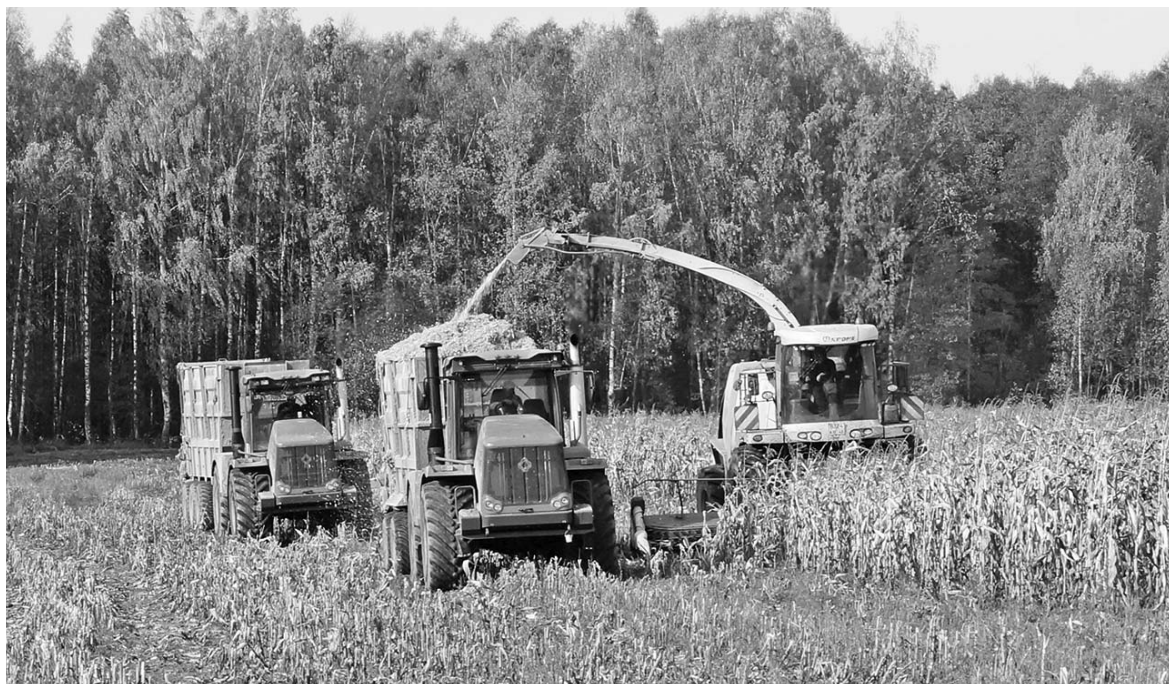
Уборка кукурузы в агрофирме «Кадви».